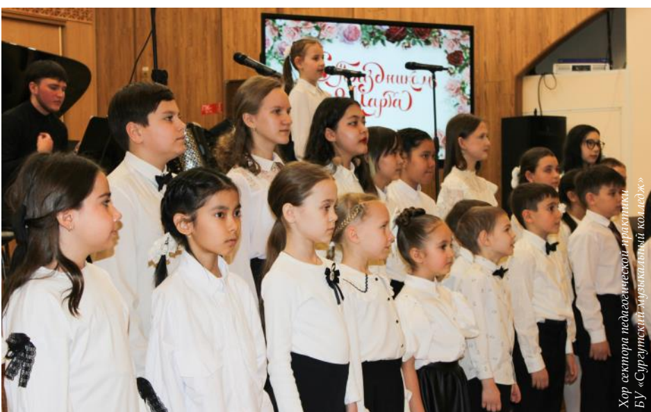
Хор сектора педагогической практики БУ «Сургутский музыкальный колледж»