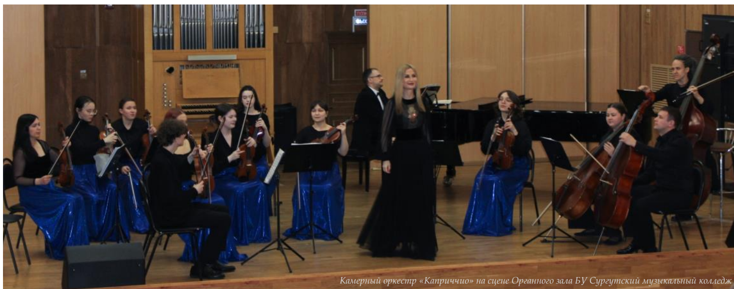
Камерный оркестр «Каприччио» на сцене Органного зала БУ Сургутский музыкальный колледж