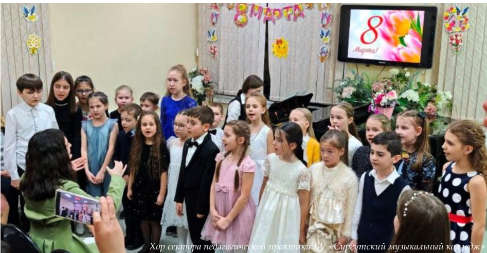
Хор сектора педагогической практики БУ «Сургутский музыкальный колледж»

IV Окружная открытая студенческая научно-практическая конференция «Путь к знаниям». Молодые исследователи представили свои работы в области музыкального искусства, языкознания, истории и педагогики. Мероприятие стало площадкой для обмена опытом и демонстрации исследовательских достижений молодёжи.