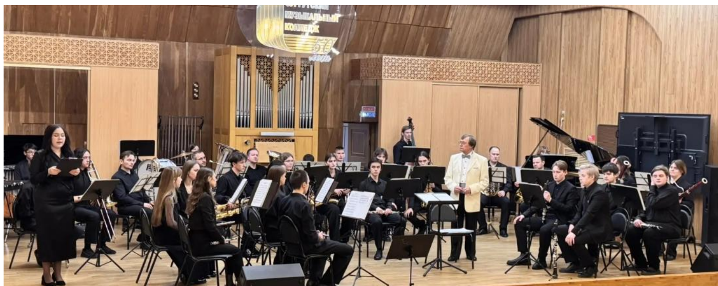
Оркестр духовых инструментов на сцене Органного зала БУ Сургутский музыкальный колледж